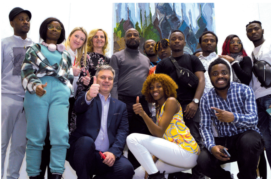
Делегация республики Камерун

Мы свою задачу видим в том, чтобы понемногу выстраивать мостик между обществом и властью. Когда три года назад писали концепцию, мы видели «Уникальную Россию» шире, чем только декоративно-прикладное искусство: ведь это и наука, и культура в широком смысле. Но понимали изначально, что сразу все не потянем. И раз мы по своему опыту больше все-таки эксперты в области искусства — это взяли за основу.