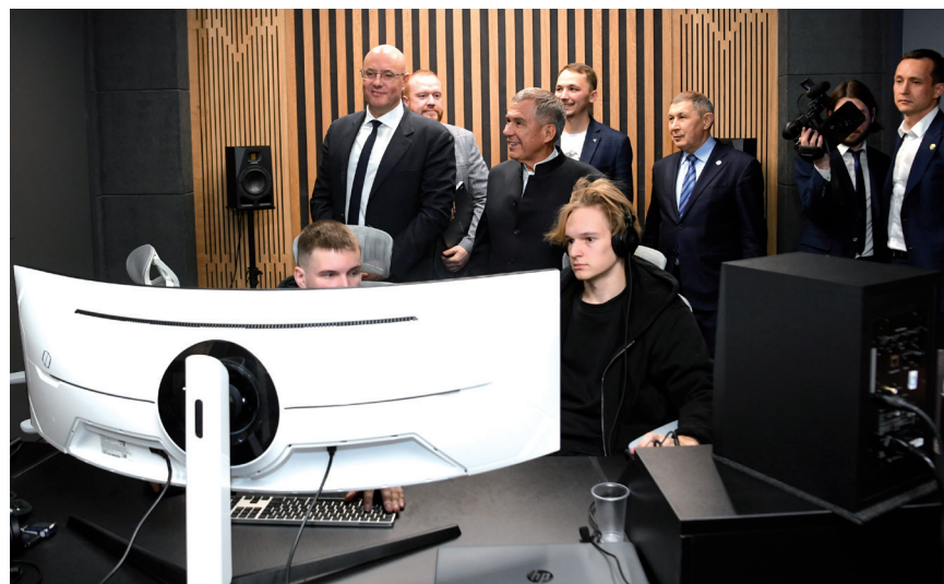
Студенты Казанского государственного института культуры в центре прототипирования

Студенты осваивали технологии создания бизнес-моделей стартапов. Во время программы шла индивидуальная и мелкогрупповая работа студентов над проектами с трекерами, экспертами, бизнес-партнерами. Более 600 студентов приняли участие в данной программе, был разработан 51 стартап, многие