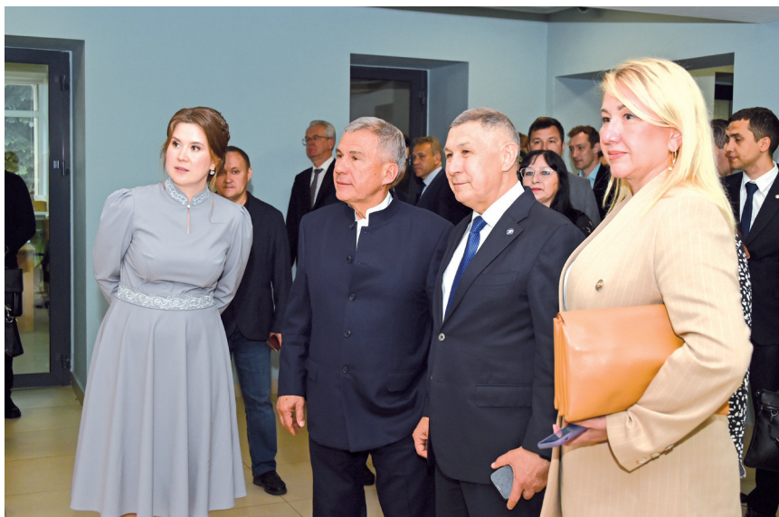
Визит президента Республики Татарстан Рустама Минниханова в Казанский государственный институт культуры

— Инжиниринговый центр работает у нас уже два года, а центр прототипирования — уже год. Эти проекты