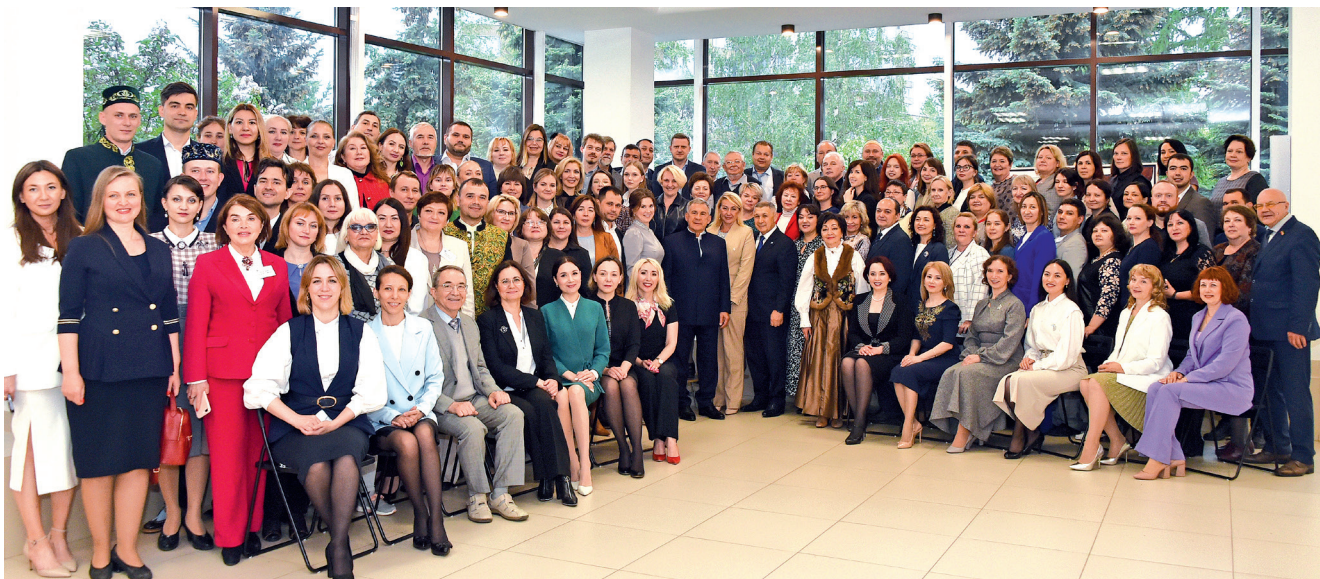
Творческий коллектив КазГИК с Президентом Республики Татарстан Рустамом Миннихановым

в частности создаются инклюзивные творческие лаборатории. В Вашем вузе что-то подобное есть?